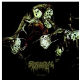
4 SPECTRAL VOICE Sparagmos