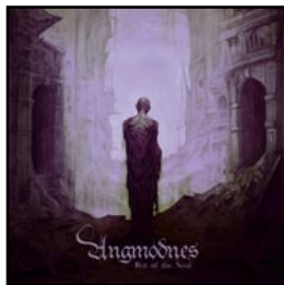
2 ANGMODNES Rot Of The Soul