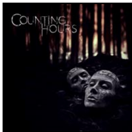
1 COUNTING HOURS The Wishing Tomb