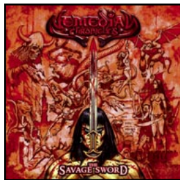
3 NEMEDIAN CHRONICLES The Savage Sword